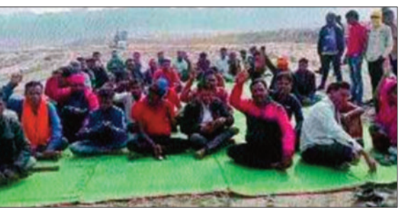
प्रदर्शन करते भूविस्थापित।