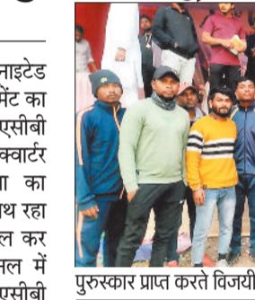
पुरस्कार प्राप्त करते विजयी टीम के खिलाड़ी।

27 दिसंबर से 29 दिसंबर को यूनाइटेड क्लब कोरबा के द्वारा फुटबाल टूर्नामेंट का आयोजन कराया गया। जिसमें एसीबी इंडिया की टीम ने भी भाग लिया। प्री क्वार्टर फाइनल मैच में एसीबी इंडिया का मुकाबला एसईसीएल कोरबा के साथ रहा जिसमें टीम ने 3-1 से जीत हासिल कर एसीबी इंडिया टीम क्वार्टर फाइनल में पहुंची। क्वार्टर फाइनल मैच में एसीबी इंडिया टीम का मुकाबला रायगढ़ एफसी के साथ रहा जिसमें टीम ने 4-0 से जीत हासिल की। सेमीफाइनल मैच में एसीबी