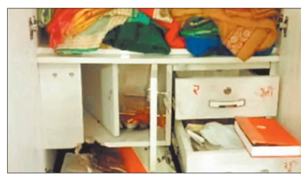
टूटी आलमारी जिससे चोरी हुए नगद व जेवरत।