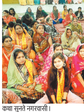
कथा सुनते नगरवासी।

गोयल परिवार पोड़ी उपरोडा के द्वारा अग्रसेन भवन कटघोरा में आयोजित श्रीमद्भागवत पुराण कथा ज्ञान यज्ञ में कथा वाचक