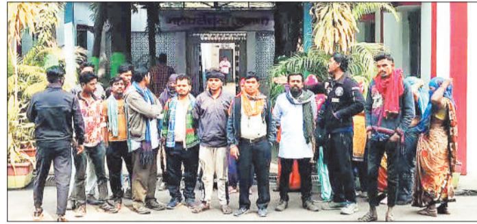
जीएम कार्यालय के सामने धरना प्रदर्शन करते टेका श्रमिक।

दिया। प्रभावित टेका श्रमिकों ने एसईसीएल जीएम कार्यालय के सामने धरना प्रदर्शन कर प्रबंधन से लंबित वेतन भुगतान जारी कराने की मांग की है। भूविस्थापितों का आरोप है कि निजी कंपनी द्वारा पिछले दो माह से वेतन भुगतान नहीं किया गया है।